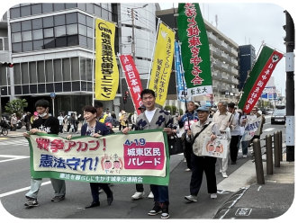
見学者の大半は名前は知りませんが、毎日新聞で知りましたと例年のない反響です。講演は今まで聞いた日中関係の話で一番まとまっていて解かりやすかったとの感想がありました。(H)

日中友好協会城北支部の参加者は支部の旗を掲げ、道行く人に「戦争のない平和な世界をつくらう！」「平和憲法を守れ！」と元気に訴えました。(柳基世)