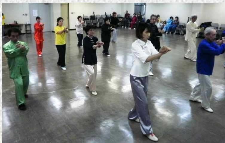
教室写真と練習風景