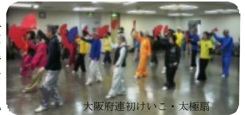
大阪府連初稽古・太極扇

7日、国労会館で大阪府連新春太極拳初稽古が50名の参加で行なわれました。大阪各教室と京都、和歌山の参加者は24式、48式、陳式、太極扇、棍術の練習に分かれて行い、休憩後にはリレー式に表演しました。最後に全員で24式太極拳を行いました。(S) 8日、守口市民体育館で守口太極拳班主催の新春初稽古が行われ、11の教室、サークルから74人の参加者は24式太極拳、48式太極拳、陳式太極拳36式の3種目に分かれて初稽古を楽しみました。