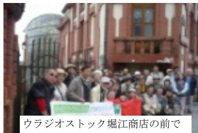
ウラジオストック堀江商店の前で

北朝鮮の軍事的挑発は許せない。しかし、軍事力対軍事力では何も解決しない。話し合いの解決に知恵を絞らなければならぬ。来年の平昌冬季オリンピックで南北合同チームを結成する提案も出されていると聞く。