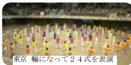
東京 輪になって24式を表演

協会の太極拳は文化活動の一つとして、1977年一月に開講し、全国に大きく普及・発展し、六千人の愛好者が集っています。次の十年をめざし「太極拳の輪」「交流の輪」を大きく広げましょう。