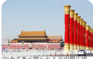
記念式典が開かれる天安門広場

中国国家統計局は九月七日、中華人民共和国建国六〇周年のシリーズ報告の第一部を発表しました。GDPの増加や寿命の延長、貧困率の低下など一連のデータが示しているのは、中国が建国六〇年以来、旧世界の廃墟のなかから立ち上がり、中国の特色のある社会主義を取り、生氣と活力に満ちた社会主義国家として世界の東方にそびえ立つようになったのだと「新華網」が伝えています。 建国以来の国内総生産（GDP）の年間平均伸び率が八・一%だったことを明らかにし、改革開放が始まった1979年以降では九・八%に加速した。 また、世界経済に占めるGDPの割合は、七八年当時の一・八%から、2008年には六・四%に拡大した。 2000年時点で9兆9215億元（約136兆円）だった