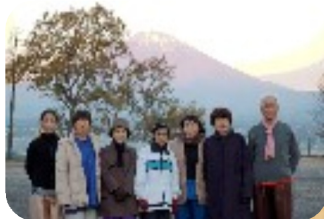
太極拳本部 指導員研修会 が行なわれま した。